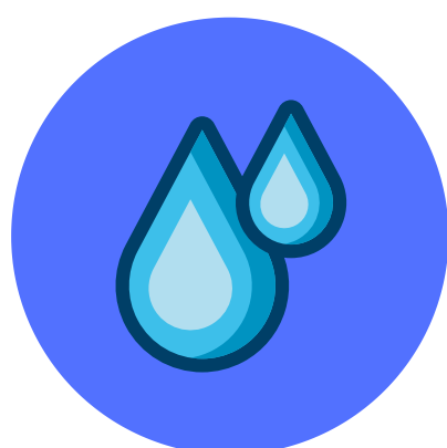
Gotículas de saliva