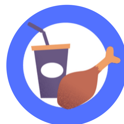
Objetos ou superfícies contaminadas