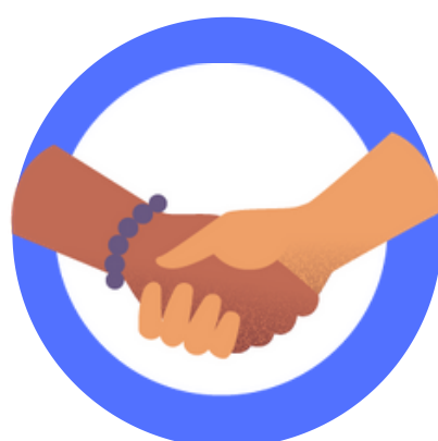
Toque ou aperto de mãos